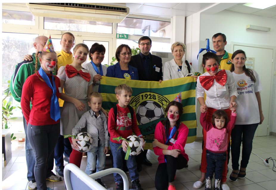
Рисунок. Опыт проведения общественно-образовательной акции «День борьбы с инсультом» в г. Краснодаре