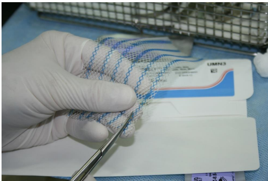
Рисунок 1 – Подготовка к операции с использованием хирургической сетки УЛЬТРАПРО производства Ethicon (Бельгия)